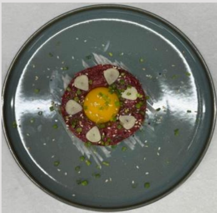
3. Koreanisches Rindertatar oder Schweizer art -26