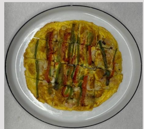
6. Galette mit Schnittlauch und Meeresfrüchten- 22