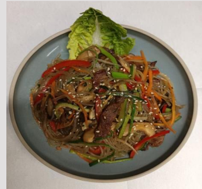
2. Koreanisches Japchae(Nudeln) - 18