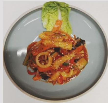
4. Gebratener Tintenfisch mit scharfem Gemüse -20.50