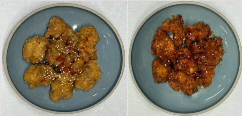
1. Frittiertes Poulet - 18.50

(Nature, mit süßer Sojasauce oder mit Chilisaucce)