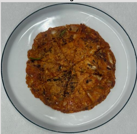
5. Kimchi-Pfannkuchen -16